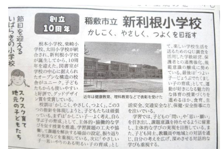
< 8月29日茨城新聞 >

先日撮影した航空写真を使った記念品（クリアファイル）も配付しますので楽しみにしてください。