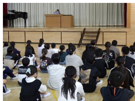
代表児童の発表を聴く子どもたちの様子

子どもたち一人一人は、キャリア・パスポートに前期の振り返りを書き留めています。後ほどご覧ください。