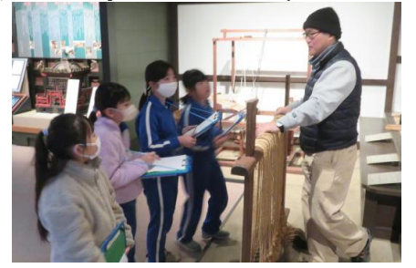
機織り機について説明を受けている様子

昔の道具について体験を行いました。「機織り」と「洗濯板」を体験し、「昔の人たちは洗濯するのも大変だったんだ」と感想をもちました。