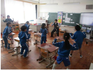
体を動かしながら学習している様子

「食べ物がおなかのどこを通るか。そしてそれらの名前と働きは何だろう。」という内容で楽しみながら学んでいました。