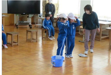
清掃の仕方について説明している様子

4月に入学してくる予定の園児達に小学校生活がどのようなものかを1年生が紹介していました。事前準備を行い、堂々と発表できました。