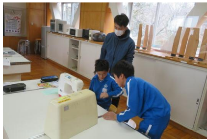
各部の名称を確認している様子

ミシンの各部の名称を覚えながら実際に練習用布を使って使い方を学習していました。説明を真剣に聞き、丁寧に操作することができました。