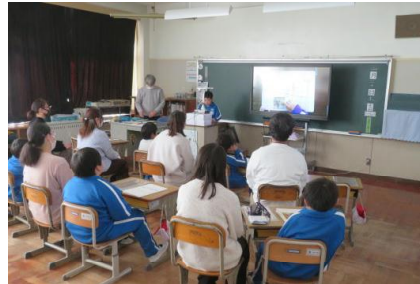
学習の成果を発表している様子

算数や学級活動の授業で児童はこれまでの成長を見せることができました。参観後学級懇談を行い今年度の振り返りについて共有しました。