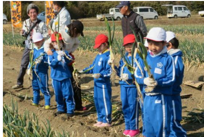
抜いたねぎの様子を確認している様子

JA 稲敷の協力で、「ねぎ抜き」を体験しました。ねぎ畑の様子を見ながら、「ねぎ」について説明を聞き、実際に抜く体験を行いました。