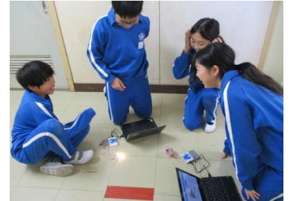
プログラムの確認を行っている様子

LEDライトやセンサーを使用してプログラミングの活動を行いました。ペアになり器具を使って回路を組み立ててコンピュータで設定しました。