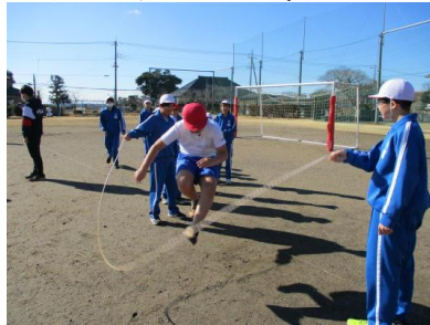
班ごとに八の字跳びを行っている様子

縦割り班ごとに八の字跳びを行いました。うまく跳べなかった下級生達も上級生達の声かけや励ましで上手に跳べるようになりました。