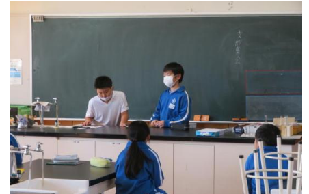
新班長を中心に話し合いをしている様子

これまでの登下校についての反省を行い、新登校班における新班長と新副班長の選出を行いました。3月11日から新登校班での登下校を始めます。